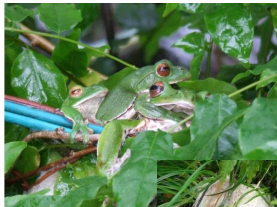
産卵行動中のモリアオガエル

また、当施設では保護飼育中のオオサンショウウオの夜の行動を観察することもできます。