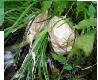
草に生み付けられた卵塊