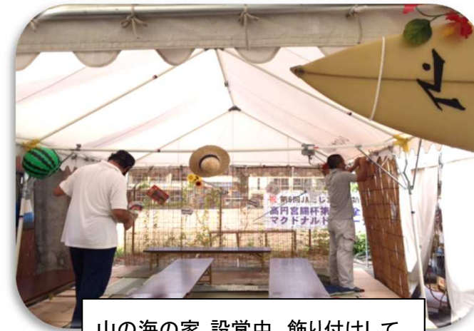
山の海の家 設営中。飾り付けして どんどん夏らしくなります。

らえれば、と企画し、簾やうちわ、麦わら帽子、スイカの浮き輪など飾って夏らしく仕上げました。夏祭り当日はここで生野小学校の同窓会も開かれ、皆さんが楽しい時間を過ごされました。