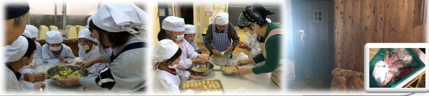
坑道内の熟成倉庫

新しい取り組みとして、料理教室で使うサツマイモの甘味が増すようにと生野銀山の坑道内でサツマイモの熟成を試みました。スタッフ内で試食したところ甘味が増しているように感じました。次回の開催時には熟成して甘味が増したサツマイモを使えるように今後も実験を重ねたいと思います。