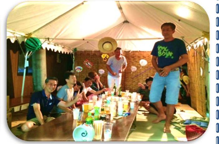
同級生の皆さん。楽しく話がはずんでいました。