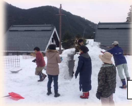
黒川雪遊び 皆で力を合わせてかまくらづくり

2月初旬の休日、白銀の世界となった黒川へ出かけました。 なにやら子ども達の明るい声が.....と近づいてみると 農家民宿「まるつね」さんのお客様のご家族が本格的な「かまくら」を作っていました。 雪をブロック状に固め、一つ一つ積み上げて、なかなか格好の良い出で立ちの「かまくら」が出来ました。