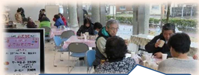
ゆっくりとくつろいでいただきました。