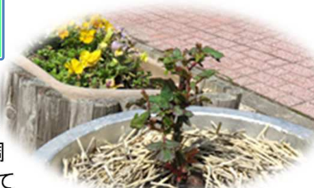
“開花が楽しみです”

メインホール前のバラ「絆」も、3月の中旬に剪定されて、葉っぱがほとんどなくなりましたが、元気に新芽を出しました。⇒ また、3月末に町内23ヶ所のバラを巡回観察されたところ、順調に成長しており、「5月20日前後には開花するだろう」と予想されています。