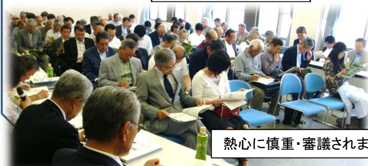
熱心に慎重・審議されました。