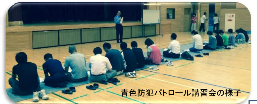
青色防犯パトロール講習会の様子