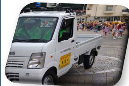
青色防犯パトロール風景

あんしん部会では今後ともこの講習会を開催していく予定ですので未講習者の方の積極的なご参加をお願いいたします。また、パトロール活動へのご支援ご協力もあわせてお願いいたします。