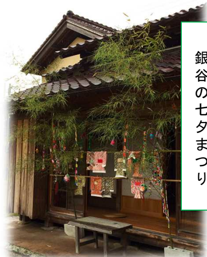
初めて参加した銀谷の七夕まつり

生野の皆さんと色々な話をしたいので見かけたら声をかけて下さい。 生野の事、いっぱい知りたいです。 生野の自慢もお願いします♪