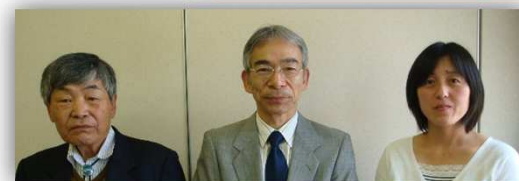
左から新しく選ばれた小牧副会長、藤原会長、椿野副会長