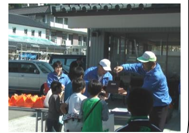
表彰式 賞品は生野特産品の詰合せ