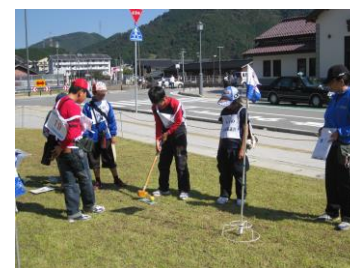
生野駅西口のグランドゴルフ