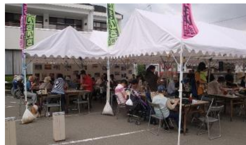
懐かしい写真も飾った食堂は大勢のお客さんで大賑わい

今年は福祉センター前に場所が変わりましたが、たくさんの人に来ていただき賑わいました。