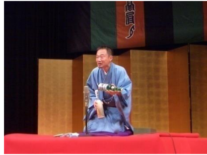
熱のこもった落語