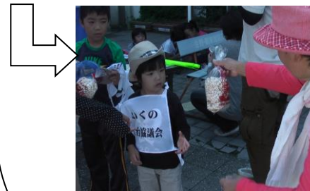
いきいき部会皆さんのポン菓子