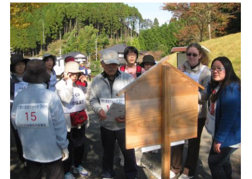
びわの丸での歴史クイズ