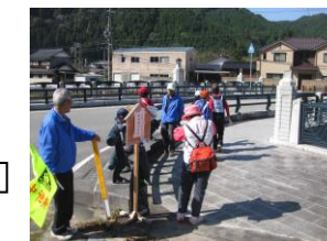
盛明橋チェックポイント